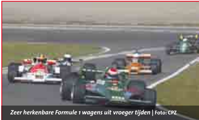
Ze herkenbare Formule 1 wagens uit vroeger tijden

Brommende motoren. Het zwaar dreunende geluid van een V8 uit oude racewagens die ooit op het asfalt van Le Mans te zien waren. Het onmiskenbare gejack van de Cosworth Formule 1 motoren. Het zorgde vooral voor veel nostalgische sfeer op de Zandvoortse racepiste afgelopen weekend.